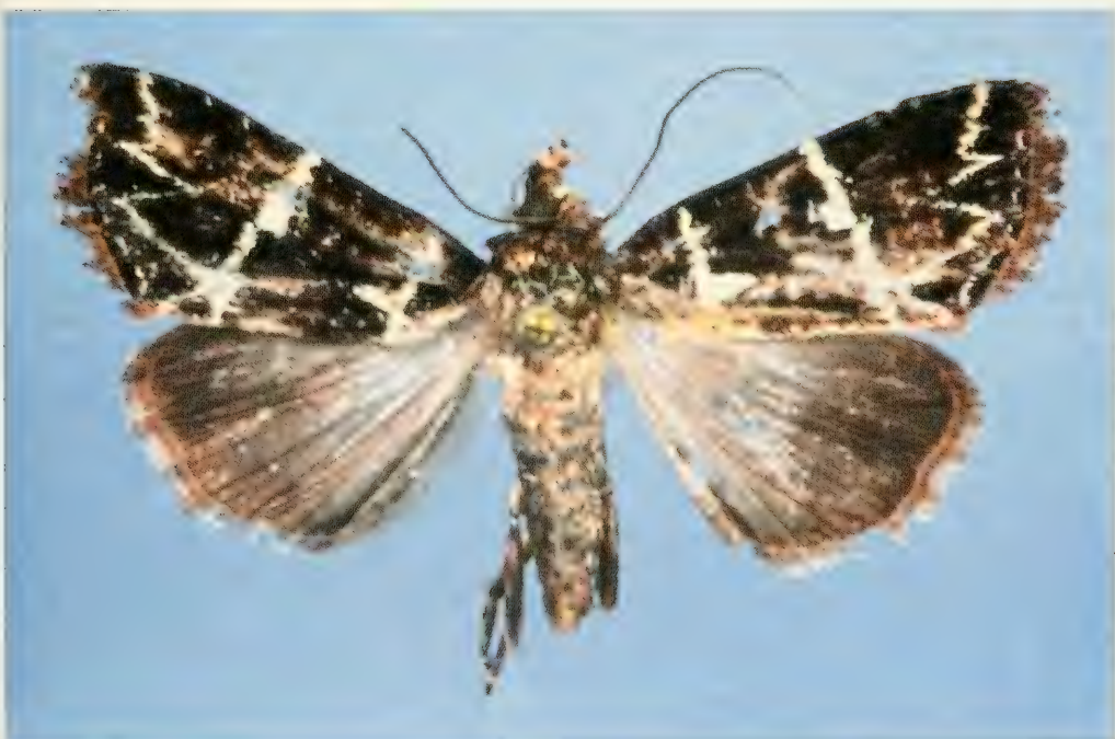
Abb. 5. Borbotana petrae , spec. nov., Paratypus, Habitus.